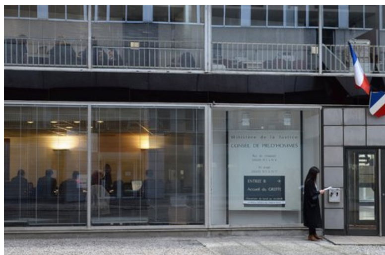
Conseil des prud'hommes de Lyon