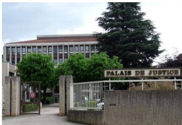
Conseil des prud'hommes de Villefranche