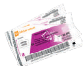
Up chèque culture