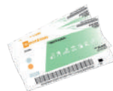
Up sport & loisirs