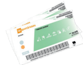
Up sport &amp; loisirs