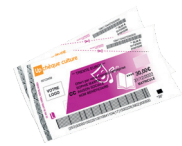
Up chèque culture